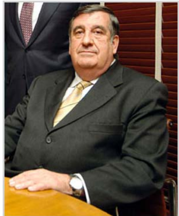
El ex presidente de Unión Fenosa, López Jiménez.

Esa diferencia de escasas semanas es lo que ha llevado a que ese fastuoso plan de opciones sobre acciones haya quedado en el limbo. Gas Natural no ha incluido la ejecución de esos títulos en su informe sobre gobierno corporativo relativo a 2009. Y Fenosa, ya excluida de bolsa, tampoco lo notificó a la Comisión Nacional del Mercado de Valores cuando sus ejecutivos convirtieron los títulos en dinero.