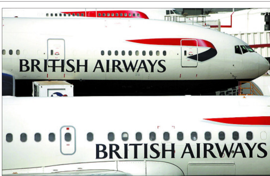
Aparatos de British Airways en el aeropuerto de Heathrow (Londres).

El régimen de compensaciones que disfrutaban los trabajadores del FMI contrasta con las frecuentes recomendaciones del Fondo a los gobiernos europeos para que reformen sus sistemas de pensiones y retrasen la edad de jubilación.